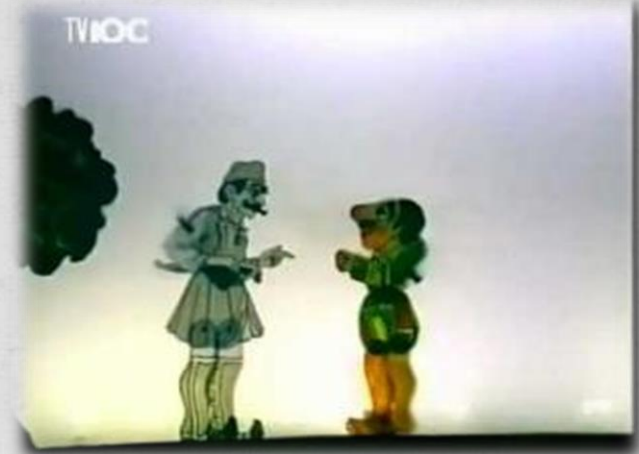
"Της Άρτας το γιοφύρι" Θέατρο Σκιών Χατζή

Παρόλα αυτά, 30 εγώ τιμωρήθηκα για την καλοσύνη και τη συμπόνια μου.