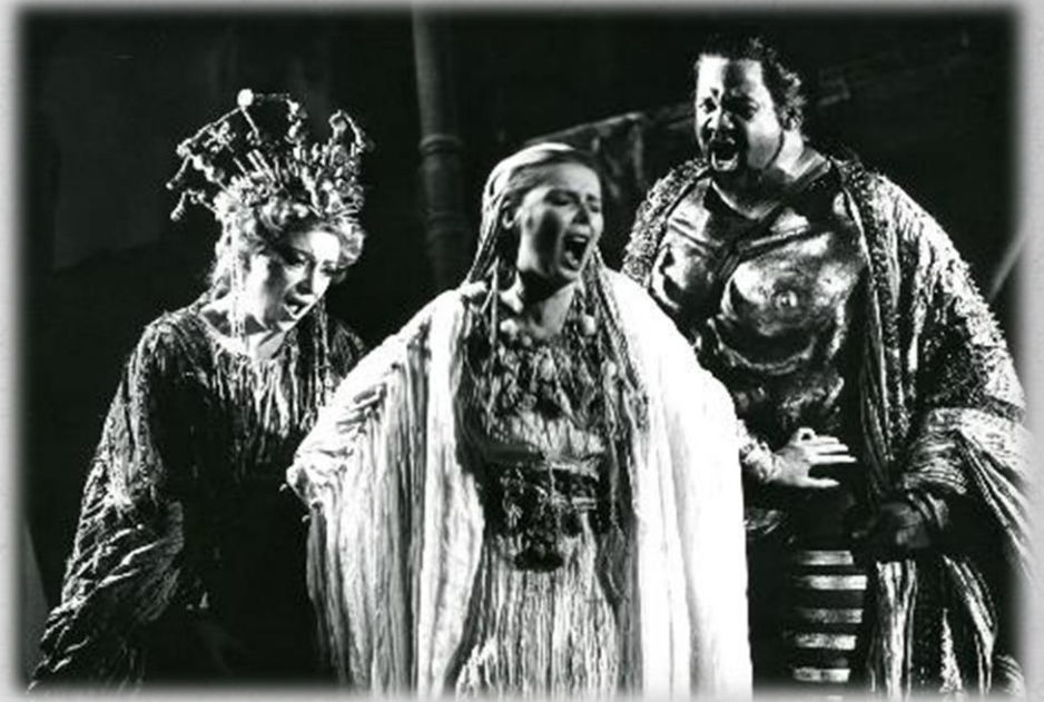
Frankfurt State Opera

Ο Αγαμέμνονας είχε προκαλέσει την οργή της θεάς Αρτέμιδος, καθώς είχε σκοτώσει το ιερό ελάφι της. Αυτό οδήγησε τη θεά να προκαλέσει άπνοια και να μην μπορούν να αποπλεύσουν τα πλοία των Αχαιών για την Τροία. Όταν ρωτήθηκε ο μάντης Κάλχας τι έπρεπε να γίνει για να φυσήξει ευνοϊκός άνεμος, η απάντηση ήταν πως ο Αγαμέμνων έπρεπε να θυσιάσει την κόρη του την Ιφιγένεια. Αρχικά ο Αγαμέμνων αρνήθηκε, αλλά έπειτα πείσθηκε από τον αδελφό του τον Μενέλαο, καθώς και από τον Οδυσσέα να προβεί σε αυτή την θυσία. Ο Αγαμέμνων κάλεσε την κόρη του με την πρόφαση ότι θα την αρραβώνιαζε με τον Αχιλλέα. Η Ιφιγένεια πήγε στην Αυλίδα όπου ο πατέρας της την παρέδωσε στον μάντη Κάλχα για να την θυσιάσει.