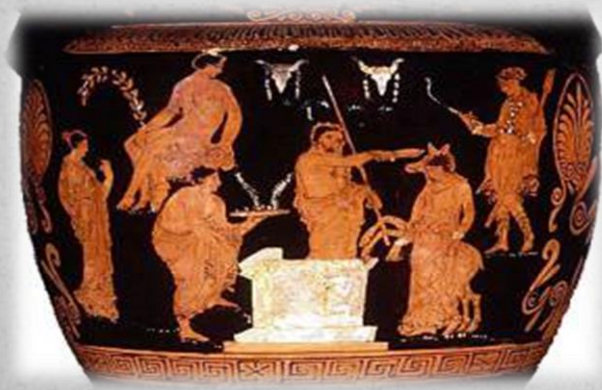
Η θυσία της Ιφιγένειας, Απουλικός κρατήρας, 370-350 π.Χ., Λονδίνο, Βρετανικό Μουσείο