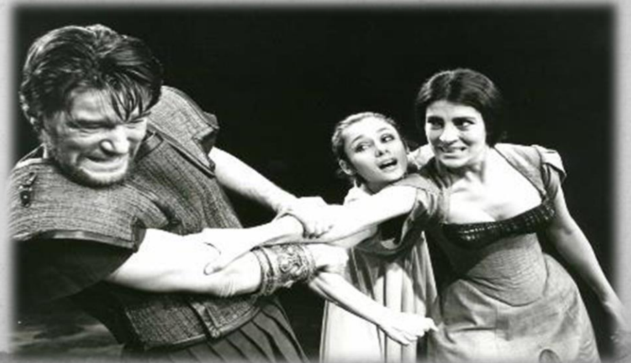
Circle in the Square (Νέα Υόρκη)