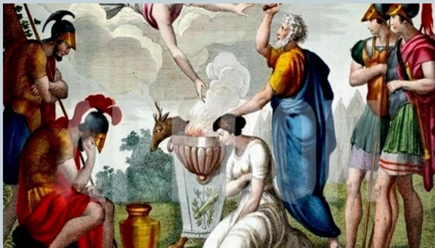
Η θυσία της Ιφιγένειας

Στο τέλος επέρχεται η λύση. Συγκεκριμένα, στο δημοτικό τραγούδι η γυναίκα του πρωτομάστορα αποδέχεται τη θυσία της για χάρη του αδερφού της, αίροντας την κατάρα και μετατρέποντάς τη σε ευχή. Η Ιφιγένεια αποδέχεται το καθήκον της και για χάρη του πολέμου, για να νικήσει η Ελλάδα, η πατρίδα της, θυσιάζεται.