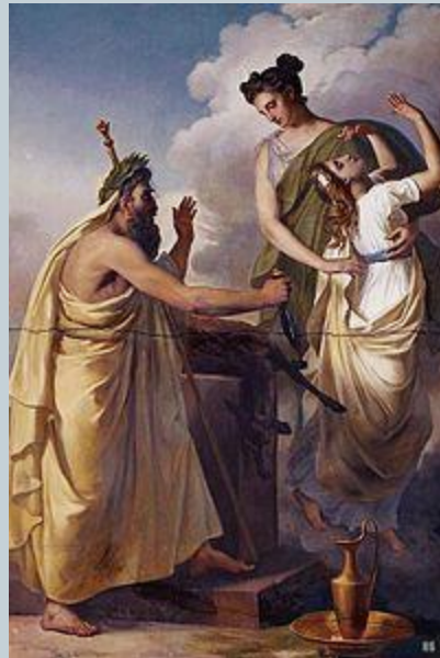
Ο μάντης Κάλχας δίνοντας τον χρησμό

Το πουλί και ο μάντης προτείνουν ως λύση τη θυσία της γυναίκας του πρωτομάστορα και της Ιφιγένειας. Φαίνεται πως δεν είναι τυχαία η επιλογή των θυμάτων, αφού πρόκειται για τραγικά πρόσωπα. Είναι παρόμοιος, λοιπόν, ο τρόπος που τα δύο πρόσωπα λειτουργούν ως εκτελεστικά όργανα των επιταγών της μοίρας.