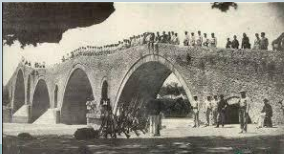
Μαθητές και μάστορες (Χορός) στο γιοφύρι

Οι δύο ηρωίδες αγνοούν το τι πρόκειται να συμβεί, ενώ όλα τα πρόσωπα γνωρίζουν (στο δημοτικό τραγούδι: μαθητές, μάστορες που ενεργούν ως Χορός σε αρχαία τραγωδία, καθώς συμμετέχουν στο δράμα, στην τραγωδία του Ευριπίδη: οι υπόλοιποι βασιλείς στο συμβούλιο ), στοιχείο τραγικής ειρωνείας. Ακόμη, υπάρχει το στοιχείο της περιπέτειας που εντείνει την τραγικότητα των προσώπων, καθώς παρατηρείται μεταστροφή της τύχης από την ευτυχία στη δυστυχία.