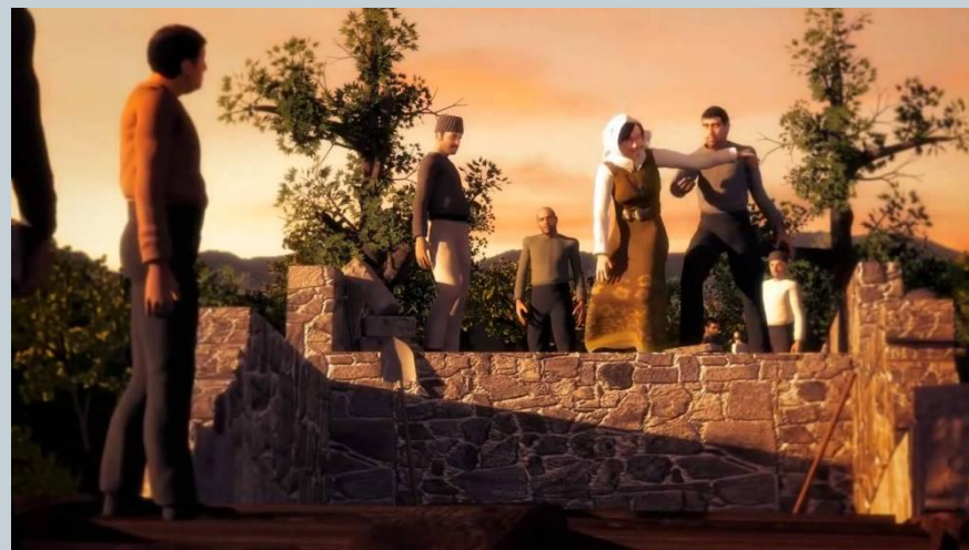
Η θυσία της γυναίκας του Πρωτομάστορα