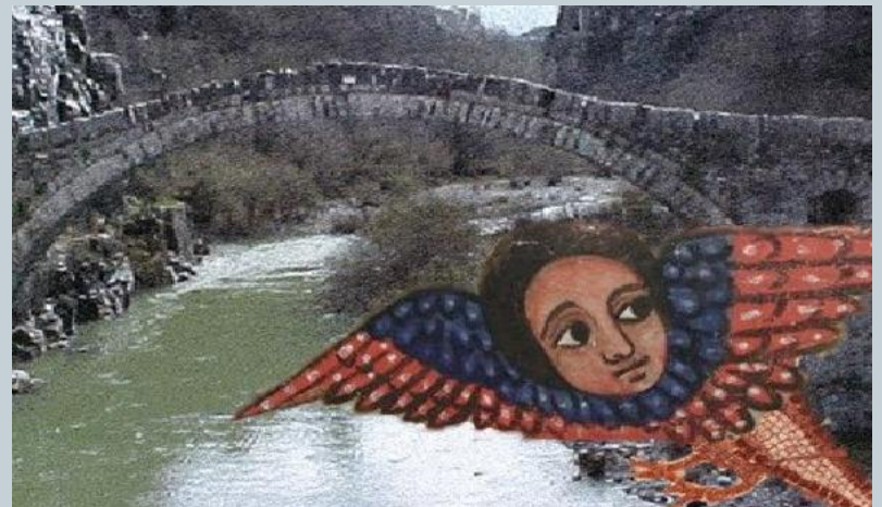
Το πουλί πετώντας στο γιοφύρι