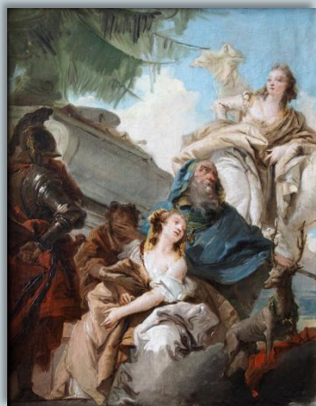
Η θυσία της Ιφιγένειας, έργο του Giovanni Battista Tiepolo

Ο τρόπος με τον οποίο οι δύο γυναίκες αντιμετωπίζουν την προδοσία των αγαπημένων προσώπων τους είναι διαφορετικός. Η γυναίκα του πρωτομάστορα είναι οργισμένη και εξαπολύει κατάρρες που ακυρώνουν τον σκοπό της θυσίας. Αντιθέτως, η Ιφιγένεια δεν παρουσιάζεται ιδιαίτερα θυμωμένη αλλά πληγωμένη, όπως φαίνεται από τον τρόπο που παρακαλάει και ικετεύει, πεσμένη στα γόνατα, τον πατέρα τη να μην της αφαιρέσει τη ζωή.