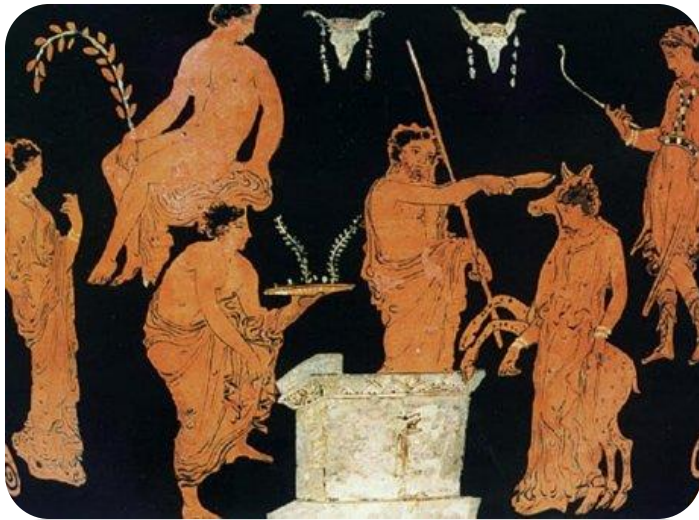
Η θυσία της Ιφιγένείας