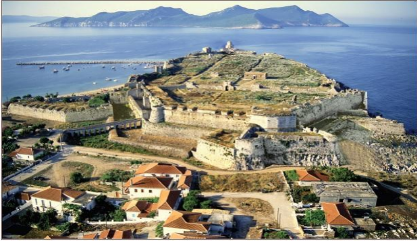
Εικ. 1: Κάστρο της Μεθώνης.