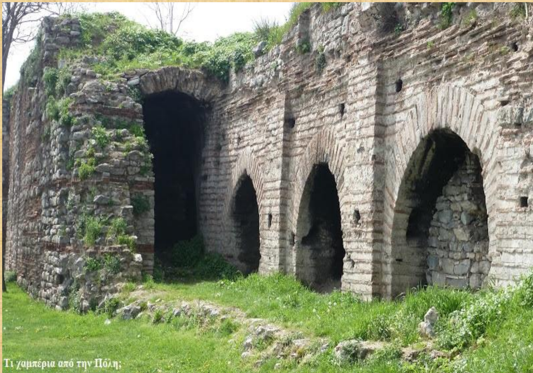
Τι χαμπέρια από την Πόλη;

Κάτω από την Αγιά Σοφία υπήρχε το προσωπικό λιμάνι του Αυτοκράτορα. Κάπως έτσι θα μπορούσε να μοιάζει με την είσοδο και τις μικρές πύλες των Τειχών