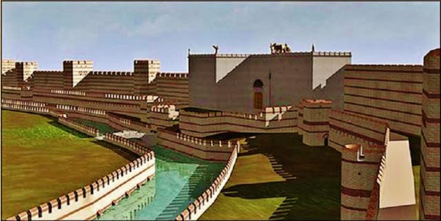
Η τείχιση της Κωνσταντινούπολης