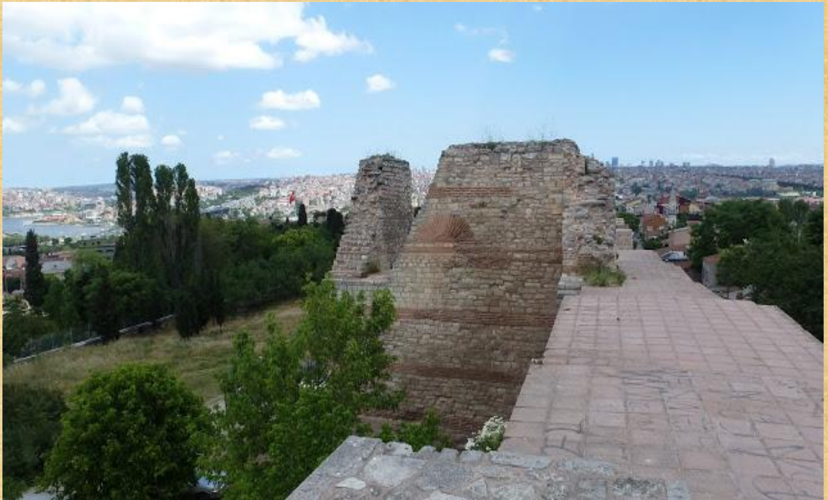
Περπατώντας στις κορυφές των Τειχών