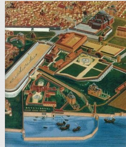
Το ιερό (μέγα) Παλάτιον

Στην Κωνσταντινούπολη, δίπλα στον Ιππόδρομο δέσποζε το Μέγα Παλάτιον, με υπέροχη θέα στη θάλασσα του Μαρμαρά προς το νότο και στο Βόσπορο προς τον Βορρά. Χρησίμευε ως αυτοκρατορική κατοικία και διοικητικό κέντρο και ήταν ένα συγκρότημα κτιρίων χρονολογούμενο σε διάφορες εποχές και με διάφορες μορφές.