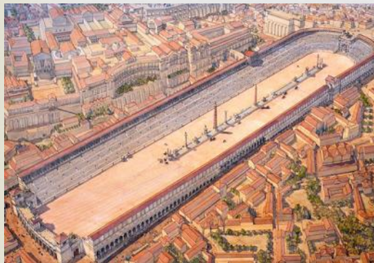
Το χαμηλό φράγμα Εύριππος γύρω από το οποίο γινόταν οι ιπποδρομίες