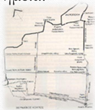
Το περίγραμμα των βυζαντινών τειχών της πόλης