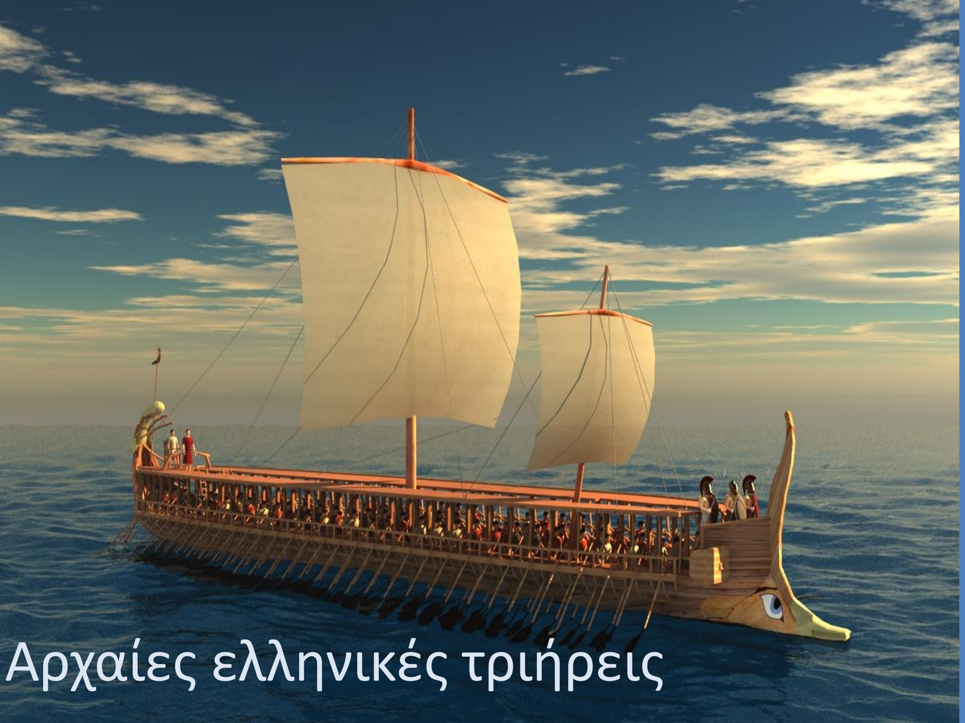
Αρχαίες ελληνικές τριήρεις