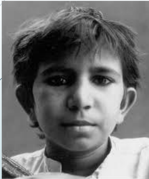
Iqbal Masih 1994

Ο Ικμπάλ Μασί βραβεύτηκε το 1994 με το Βραβείο Ανθρωπίνων Δικαιωμάτων Reebok και έδωσε ομιλίες κατά της παιδικής εργασίας σε πολλά μέρη του κόσμου. Αμέσως μετά το ταξίδι του επέστρεψε στο χωριό του στο Πακιστάν για να γιορτάσει μαζί με την οικογένειά του, που ήταν ορθόδοξη, το Πάσχα. Όμως, δολοφονήθηκε την ημέρα του Πάσχα του 1995, στη Μουρίτκε, ένα χωριό στο Πακιστάν, από την «Μαφία των Χαλιών». Τότε, ήταν περίπου 13 χρονών. Τρεις μέρες τη δολοφονία του, εκατοντάδες παιδιά διαδήλωσαν στους δρόμους της Ινδίας σε ένδειξη διαμαρτυρίας. Ειδικότερα, οι μαθητές στις ΗΠΑ δεν έμειναν με δεμένα τα χέρια. Για να τιμήσουν τον Ικμπάλ έκαναν καμπάνια για να μαζέψουν δωρεές από όλα τα σχολεία της χώρας και να χτίσουν ένα σχολείο για τον Ικμπάλ. Η εκστρατεία τους πήγε εξαιρετικά και στη 10η επέτειο του θανάτου του είχαν συγκεντρωθεί χρήματα για 8 σχολεία σε διάφορες χώρες του κόσμου.