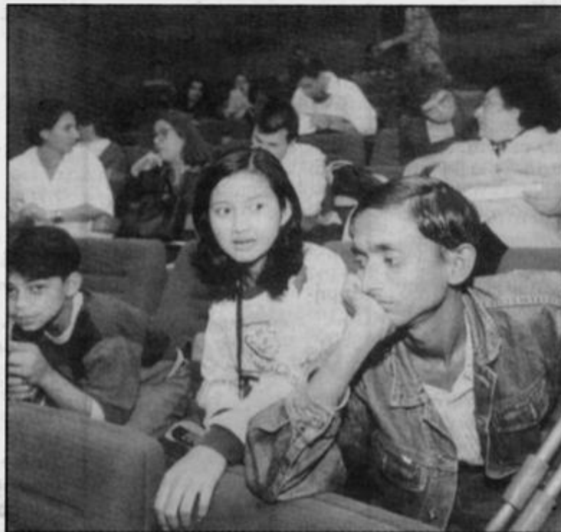
Παιδιά από την Ασία που αγωνίζονται για την κατάργηση της παιδικής εργασίας ήρθαν και στη χώρα μας

Η πρωτοβουλία «Παγκόσμια πορεία κατά της παιδικής εργασίας» διοργανώνει σήμερα τις 7.30 μ.μ. στο Σύνταγμα κε-