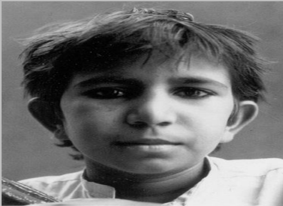
Iqbal Masih 1994

σύμβολο, μέσα από την προσπάθειά του να κερδίσει την ελευθερία του και να βελτιώσει τις συνθήκες ζωής για τον εαυτό του και τα εκατομμύρια παιδιά που εργάζονται στη χώρα του αλλά και παγκοσμίως. Ο μικρός ήταν ένας βιοπαλαιστής, ο οποίος αγωνίστηκε παρά το μικρό της ηλικίας του, για την υπεράσπιση των δικαιωμάτων των παιδιών, άλλαξε τη νοοτροπία πολλών και δε σταμάτησε τον αγώνα, παρά τις δυσκολίες. Κατά την άποψή μου, ο Ικμπάλ πρέπει να αποτελεί πρότυπο για όλους και είναι αναγκαίο να κινητοποιηθούμε ενάντια στην παιδική εργασία και εκμετάλλευση. Ακόμη, θεωρώ ότι αντιπροσωπεύει τους ανθρώπους που οραματίζονται ένα καλύτερο αύριο, περισσότερο για τους συνανθρώπους τους και λιγότερο για τον εαυτό τους. Είναι απαραίτητο ακόμη να γίνει παράδειγμα για όσους εγκαταλείπουν την προσπάθεια και τον αγώνα για μια καλύτερη ζωή. Η παιδική εργασία είναι ένα φαινόμενο τόσο αληθινό όσο αυτή η ιστορία και εκατομμύρια οικογένειες ζουν σαν σκλάβοι, υπό άθλιες συνθήκες εργασίας, εκμεταλλευόμενοι από τους οικονομικά ισχυρούς. Με τη θυσία του, ο Ικμπάλ μας έδειξε ότι είναι αναγκαία η συμμετοχή και η προσπάθεια όλων μας, για να σταματήσει αυτή η καταπάτηση των ανθρωπίνων δικαιωμάτων.