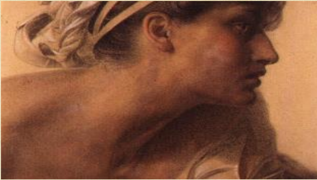
Anthony Frederick Sandys, Η Πηνελόπη

Μ'άφησε μόνη μου και δεν μπορώ να τα βάλω με όλους αυτούς. Με βασανίζουν οι χαρές και τα γέλια. Κανείς δεν θα 'πρεπε να είναι χαρούμενος, αφού λείπει ο αγαπημένος άρχοντας του τόπου.