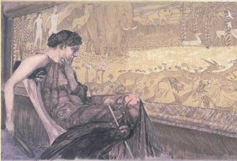
Max Klinger, Η Πηνελόπη

Μα όλοι συνεχίζουν τη ζωή τους κανονικά... Ο χρόνος πάγωσε μόνο για μένα, που περιμένω τον αγαπημένο μου να γυρίσει... Πρέπει να δείχνω δυνατή, το μόνο που έχω είναι τα κείμενά μου, για να εκφράζω τις σκέψεις και τα συναισθήματά μου.