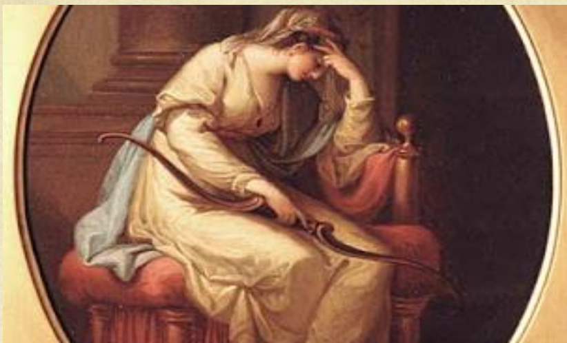
Angelika Kauffmann, Η Πηνελόπη

Σήμερα πιο πολύ από ποτέ μισώ τα τραγούδια, τα γέλια, τις φωνές. Ας πάψει πια ο Φήμιος, ας μείνουν οι αίθουσες του παλατιού σκοτεινές και κλειστές, αφού ο αγαπημένος μου Οδυσσέας δεν λέει να γυρίσει.