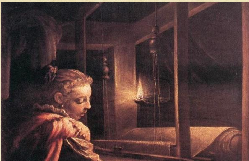
Leandro Bassano, Η Πηνελόπη

Μα όχι, δεν θα χάσω την ελπίδα μου, πως μία μέρα θα γυρίσει στο παλάτι ο Οδυσσέας και θα φέρει μαζί του τη χαρά, την τάξη και τη γαλήνη. Γνωρίζω ότι είναι ένας απλός θνητός, μα για μένα είναι ένας Θεός που κατέβηκε από τον Όλυμπο και δεν θα πάψω ποτέ να τον περιμένω!