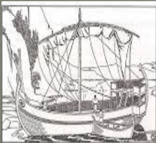
11. Επιτορκό πλοίο της αμνηλής εποχής. Αναπαράσταση από μιλονόμοφο αγγίο των Μ. και C.H.B. Quenell.