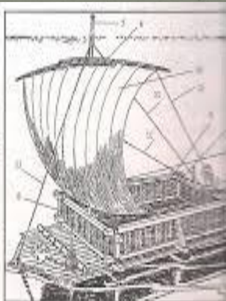
12. Αναπαράσταση της σκάφης του Ολλοσσία του...