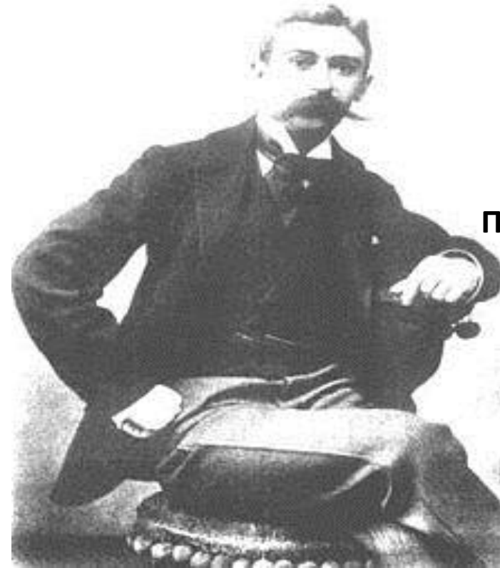
Πιέρ ντε Κουμπερτέν

Είναι γνωστό ότι κατά τον 17ο αιώνα γινόταν κάποια γιορτή, η οποία έφερε το όνομα "Ολυμπιακοί αγώνες", στην Αγγλία. Παρόμοιες εκδηλώσεις ακολούθησαν στους επόμενους αιώνες στη Γαλλία και Ελλάδα οι οποίες, όμως, ήταν μικρές. Το ενδιαφέρον για τους Ολυμπιακούς αγώνες μεγάλωσε, όταν ανακαλύφθηκαν τα ερείπια της αρχαίας Ολυμπίας από Γερμανούς αρχαιολόγους στα μέσα του 19ου αιώνα. Σε ένα συνέδριο στο πανεπιστήμιο της Σορβόνης στο Παρίσι, που έγινε από τις 16 μέχρι τις 23 Ιουνίου, το 1894 παρουσίασε τις ιδέες του σε ένα διεθνές ακροατήριο, ο Μηνάς Μηνωίδης, που τότε δίδασκε την αρχαία ελληνική γλώσσα σε πανεπιστήμιο του Παρισιού και ο οποίος μετέφρασε και δημοσίευσε στη γαλλική το "Γυμναστικό" του Φιλόστρατου (1858) με μετάφραση στα γαλλικά. συμπεριλαμβάνοντας στον πρόλογο, μια διαμαρτυρία με τίτλο «Λόγος περί της των Ολυμπιακών Αγώνων εν Ελλάδι συστάσεως». Με τον τρόπο αυτό ξεκίνησε στους κύκλους του Παρισιού μια συζήτηση περί της αναβίωσης των Ολυμπιακών Αγώνων.