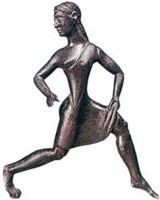
Άγαλμα Χάλκινο που παριστάνει Σπαρτιάτισσα αθλήτρια (Λονδίνο, Βρετανικό Μουσείο)

Συμμετοχή σε πολλές εκδηλώσεις της πόλης