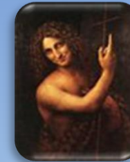
Saint Jean Baptiste