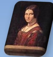
La belle Ferronnière