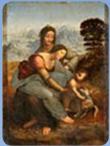
La Vierge, l'Enfant Jésus et sainte Anne