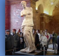
Vénus de Milo