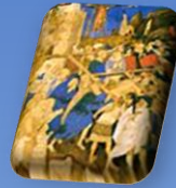
Jacquemart de Hesdin Grandes Heures de Jean de Berry Le Portement de Croix