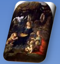
Vierge aux rochers