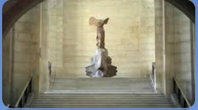
La victoire de Samothrace