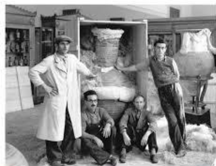
Στιγμιότυπο από τον εγκιβωτισμό του αμφορέα Α 803.